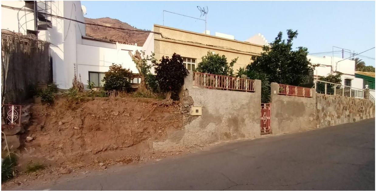
Ilustración 1 Situación actual muro